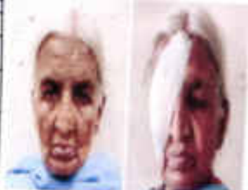
pre.op post op DFO Chennamma

PRESENT RESIDENCE ADDRESS वर्तमान आवासीय पता: H.No 509 Thalagawade Kibargalate Matavalle Mandya Karnataka PERMANENT RESIDENCE ADDRESS: स्थायी आवासीय पता: - - -